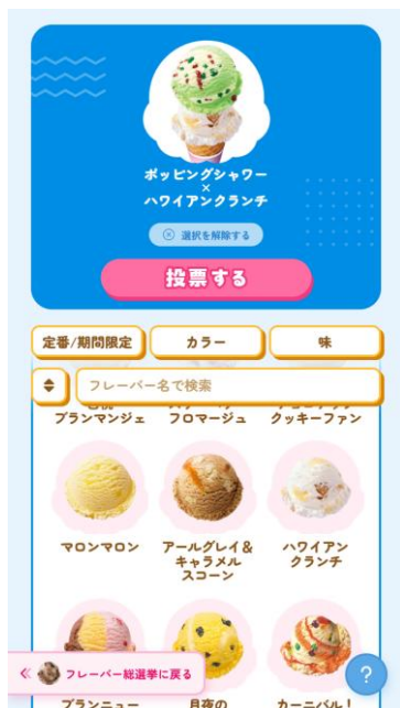
ダブル総選挙 フレーバー選択画面

投票は期間中毎日1回可能です。選挙公約として、オリジナルデザイングッズのプレゼントや、期間限定フレーバーの復刻も予定しています。また投票していただいた方には抽選で、「サーティワン貸し切り食べ放題イベント」があたります！あなたの“推しフレーバー”や“お気に入りダブル”に、ぜひ毎日1回投票してください。注目の投票結果は、5月9日（土）アイスクリームの日に発表いたします。